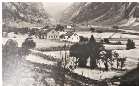
Det gamla huset og fjoset heima på Fede, Hovland.