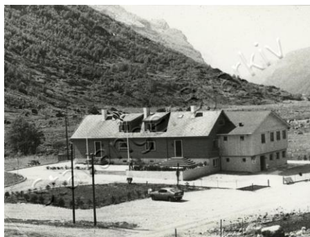
Turistheimen i Ørdsdalen (Bergmannshuset) etter åpningen 1976.