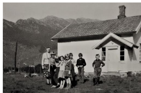
Elever ved småskolen i Ørdsalen som er fødd 1952-1954.