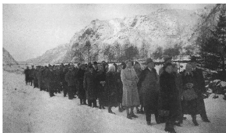
På veg til gravkapellet.