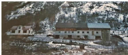
Gamla huse til Thea å Syvert Hovland.