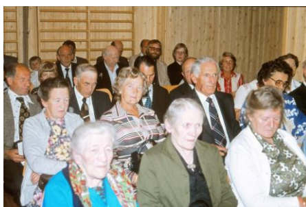
Mange kjente bjerkreimsbuer.