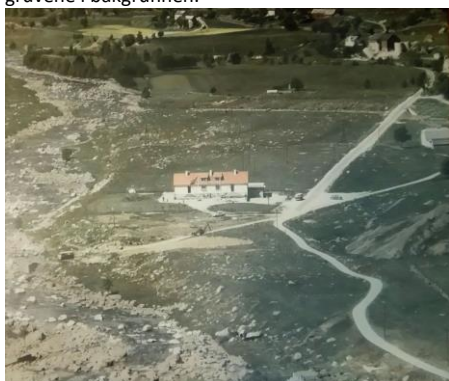
På Hovland hvor det senere ble bl.a. «Søndagskafe»